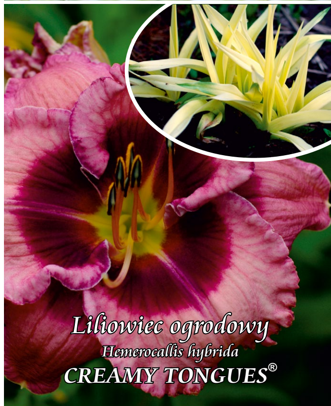
Lilowiec ogrodowy Hemerocallis hybrida CREAMY TONGUES®