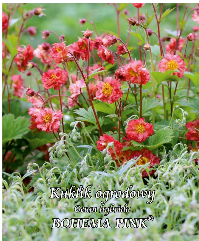
Kuklik ogrodowy Gaum hybrida BOHEMA PINK®