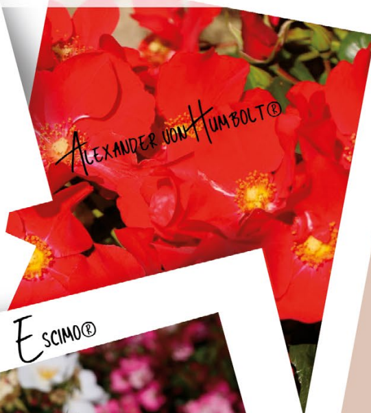
ALEXANDER VON HUMBOLT®