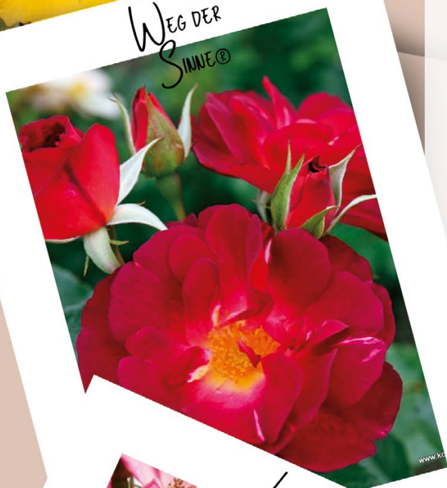
WEG DER SINNE®